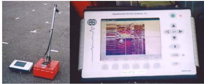
軽量・コンパクトな地中レーダSIR-3000(GSSI社製)

地中エンジニアリングは『技術創造型企業』を理念に掲げた地中の総合コンサルタント会社として、 〈地中探査〉〈漏水調査〉〈地質調査〉 を行っています。これら業務のうち、特に当社の特色は〈地中探査〉にあり、これは、様々な “物理探査” の手法を駆使することによって掘らずにわかること（間接探査・非開削工法）を目的としたものです。地中エンジニアリングでは、この物理探査の中心的な手法となる地中レーダ法について、1979年の会社設立以来、社会のニーズの変化と共に技術的発展と適用領域の開拓に努めてきました。現在では土木・建設に関わる幅広い分野において、地中探査技能検定（厚生労働省認定社内検定）の有資格技術者による適切な技術サービスを提供しています。また調査状況に応じて、物理探査に加え簡易ボーリング等を用いた 直接探査 を組み合わせた複合調査も実施しています。